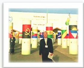
2015年 COP21 (仏: Paris)

持続可能な未来のために、ぜひとも環境省登録 環境カウンセラーの活用をご検討願うとともに、環境カウンセラーになって、ともに環境保全に取り組んでいただける方の応募もお待ちしております。このパンフレットがみなさまの関心につながれば幸いです。どうぞよろしくお願いいたします。